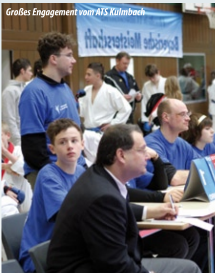
Großes Engagement vom ATS Kulmbach

zu beenden und allen eine baldige Heimreise zu ermöglichen. Beachtliche 35 Teams standen Spätnachmittag in Kata und Kumite noch auf dem Programm.