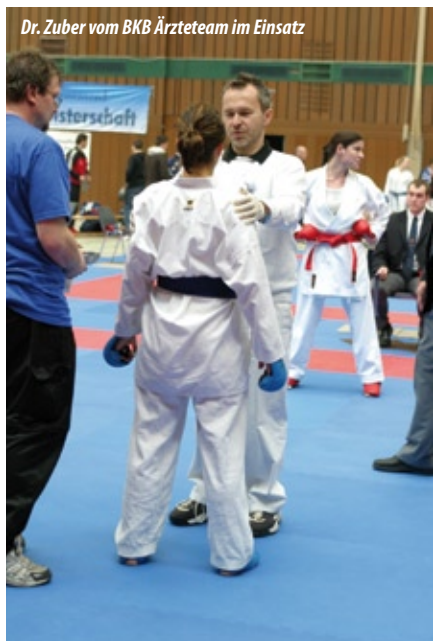
Dr. Zuber vom BKB Ärzteteam im Einsatz

keine Möglichkeit einen Punkt zu erzielen und siegte eindeutig mit 4:0.