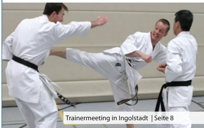
Trainermeeting in Ingolstadt | Seite 8