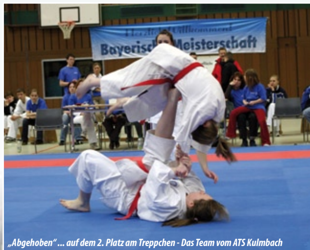
„Abgehoben“ ... auf dem 2. Platz am Treppchen - Das Team vom ATS Kulmbach