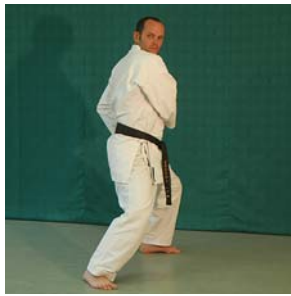
Sochin- Dachi; Yama- Zuki Chudan und Gedan Kiai!