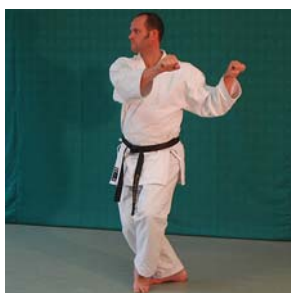
Kokutsu- Dachi Chudan- Kakiwake- Uke