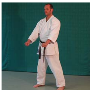
Kokutsu- Dachi (*) Chudan- Kakiwake- Uke