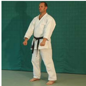
Musubi – Dachi