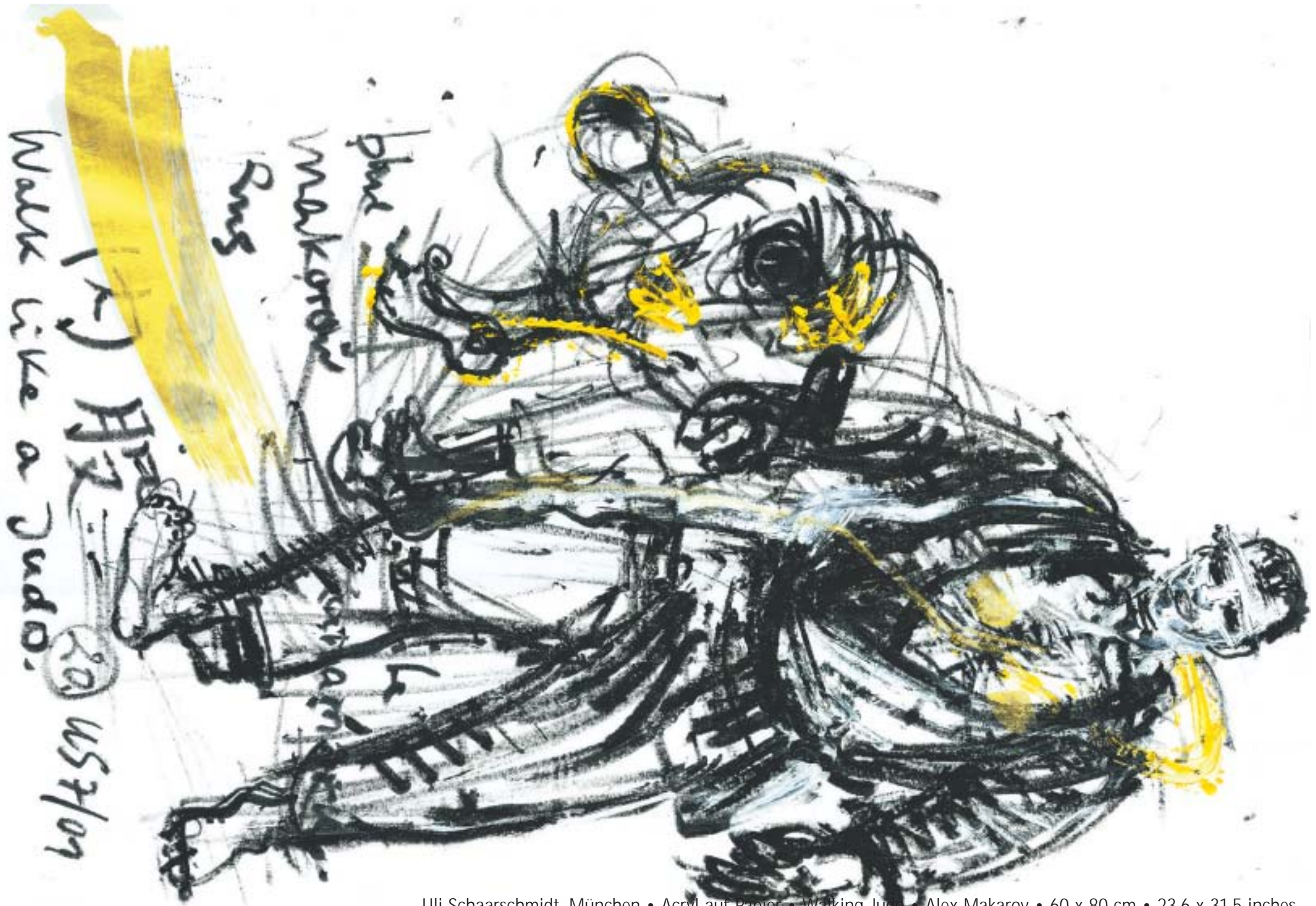
Uli Schaarschmidt, München • Acryl auf Papier • Walking Judo • Alex Makarov • 60 x 80 cm • 23.6 x 31.5 inches