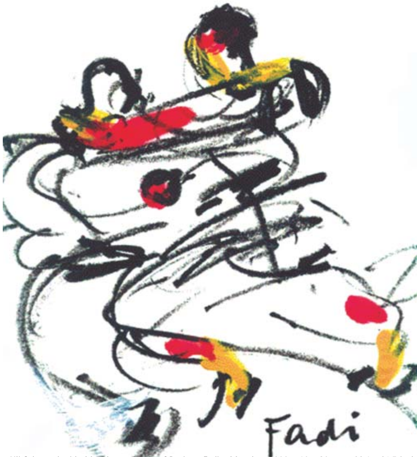
Uli Schaarschmidt, München • Acryl auf Papier • Fadi • München 2000 • 60 x 80 cm • 23.6 x 31.5 inches