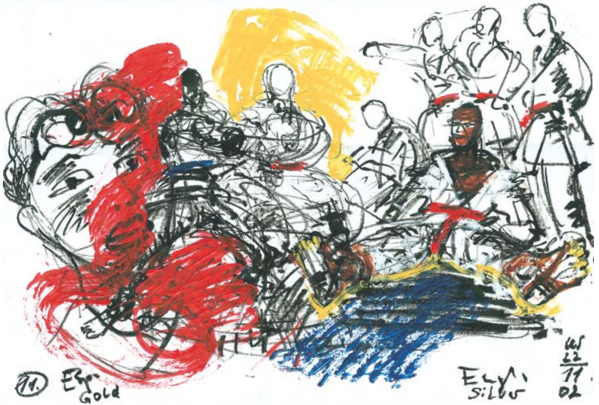
Uli Scharschmidt, München • Acryl auf Papier • Team Kumite Final • Madrid 2002 • 60 x 80 cm • 23.6 x 31.5 inches