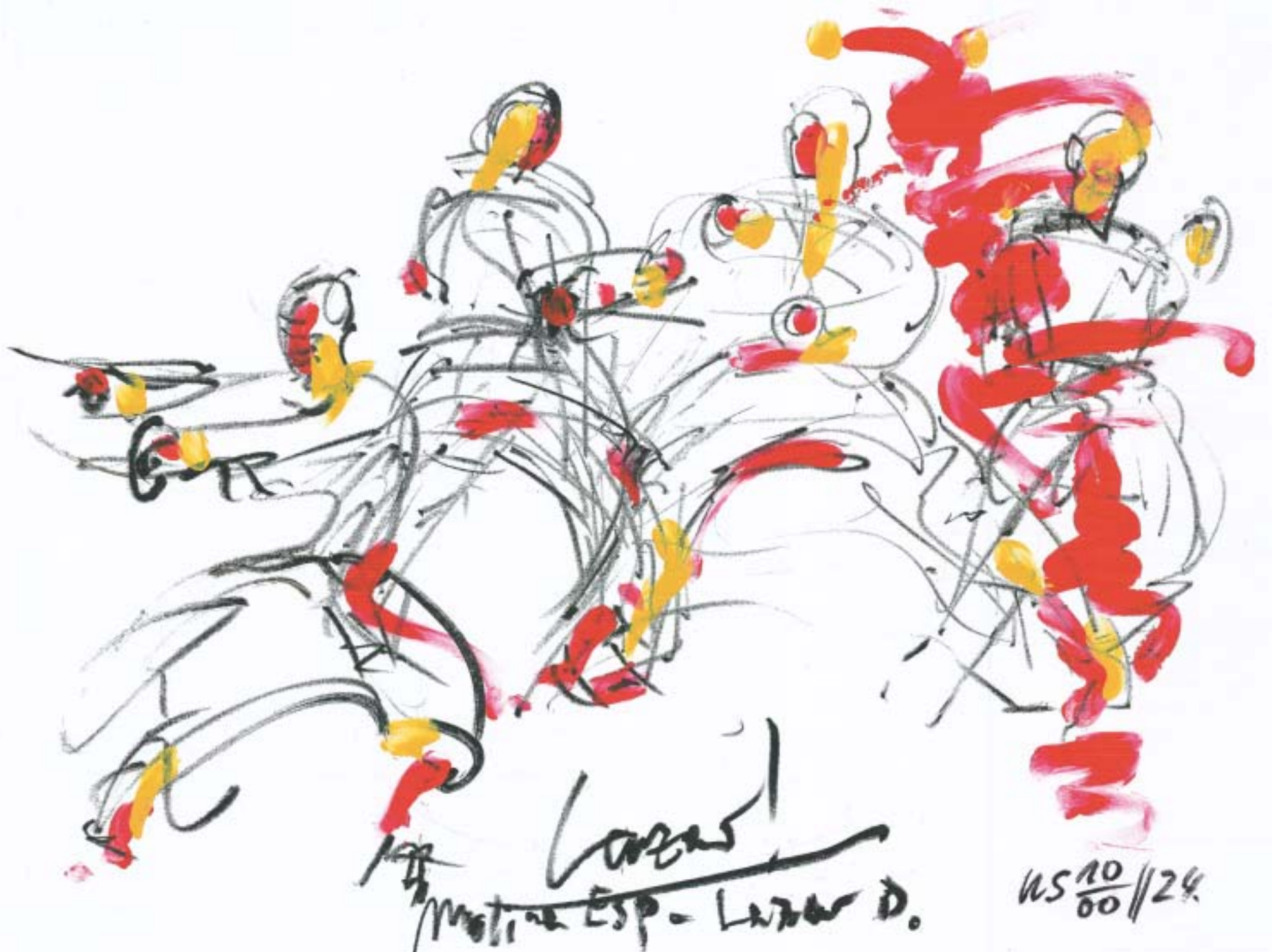
Uli Schaarschmidt, München • Acryl auf Papier • Lazar's hit • Final Lazar Boskovic - Angel Molina in Munich 2000 • 60 x 80 cm • 23.6 x 31.5 inches