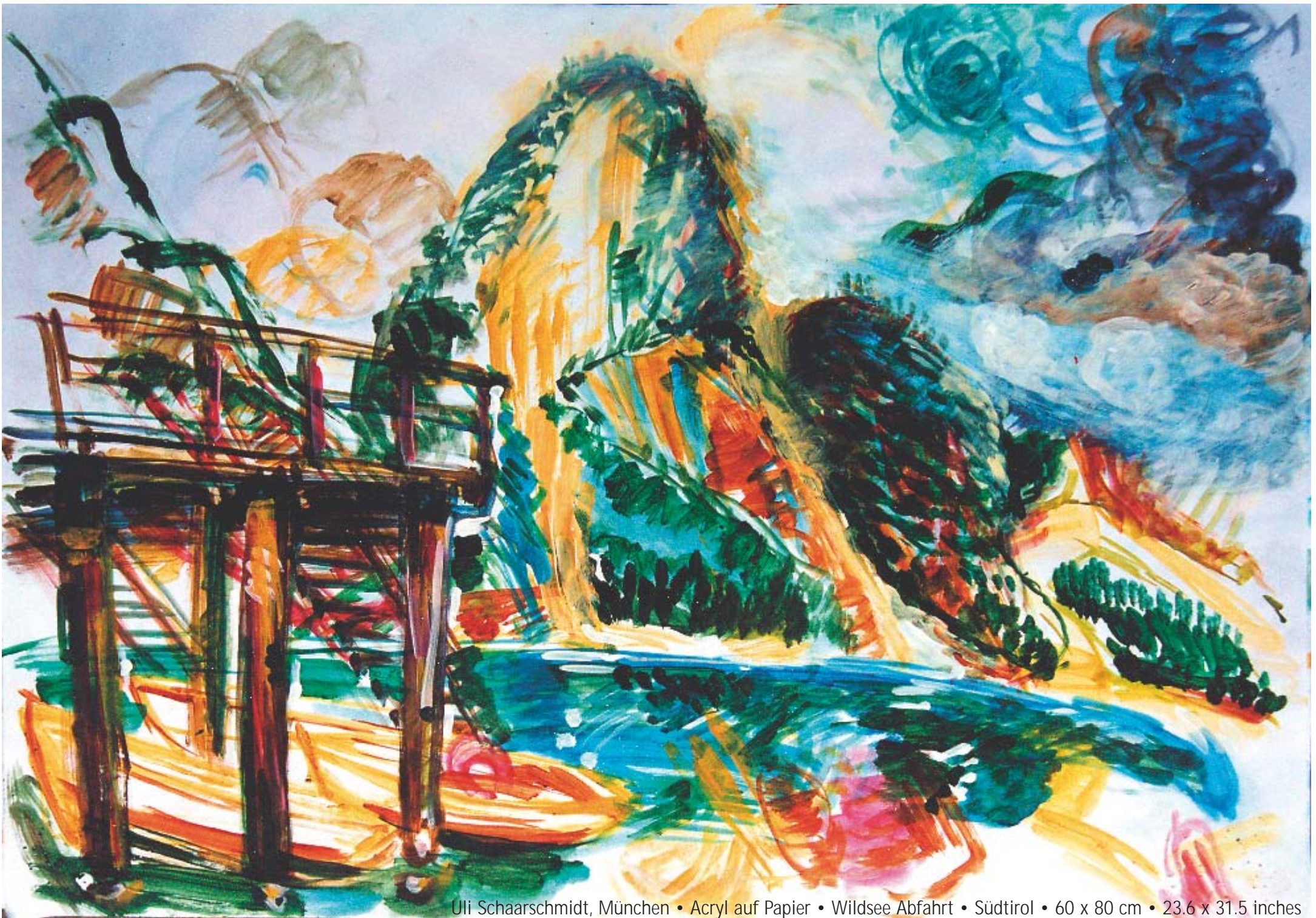
Uli Schaarschmidt, München • Acryl auf Papier • Wildsee Abfahrt • Südtirol • 60 x 80 cm • 23.6 x 31.5 inches