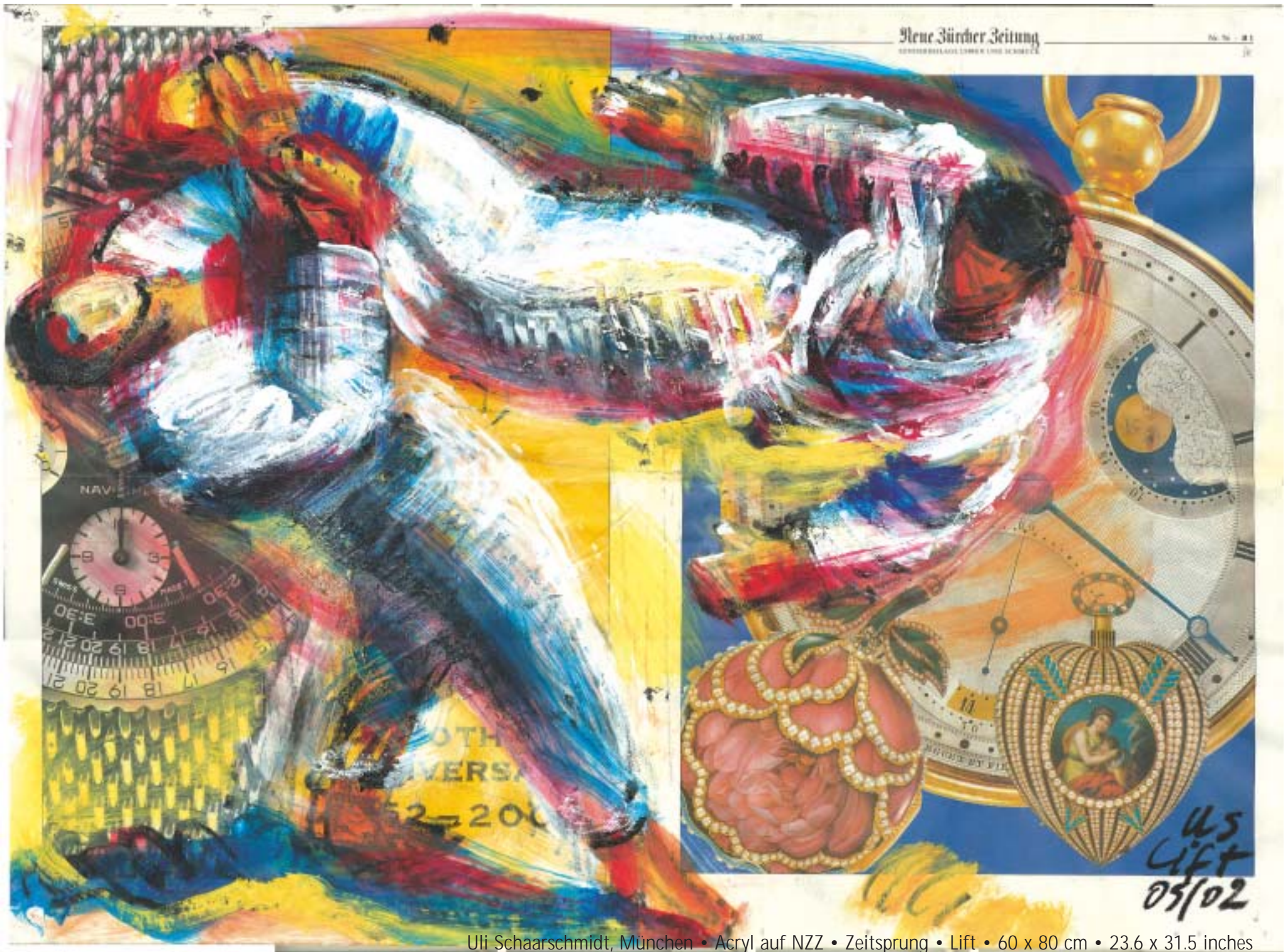
Uli Schaarschmidt, München • Acryl auf NZZ • Zeitsprung • Lift • 60 x 80 cm • 23.6 x 31.5 inches