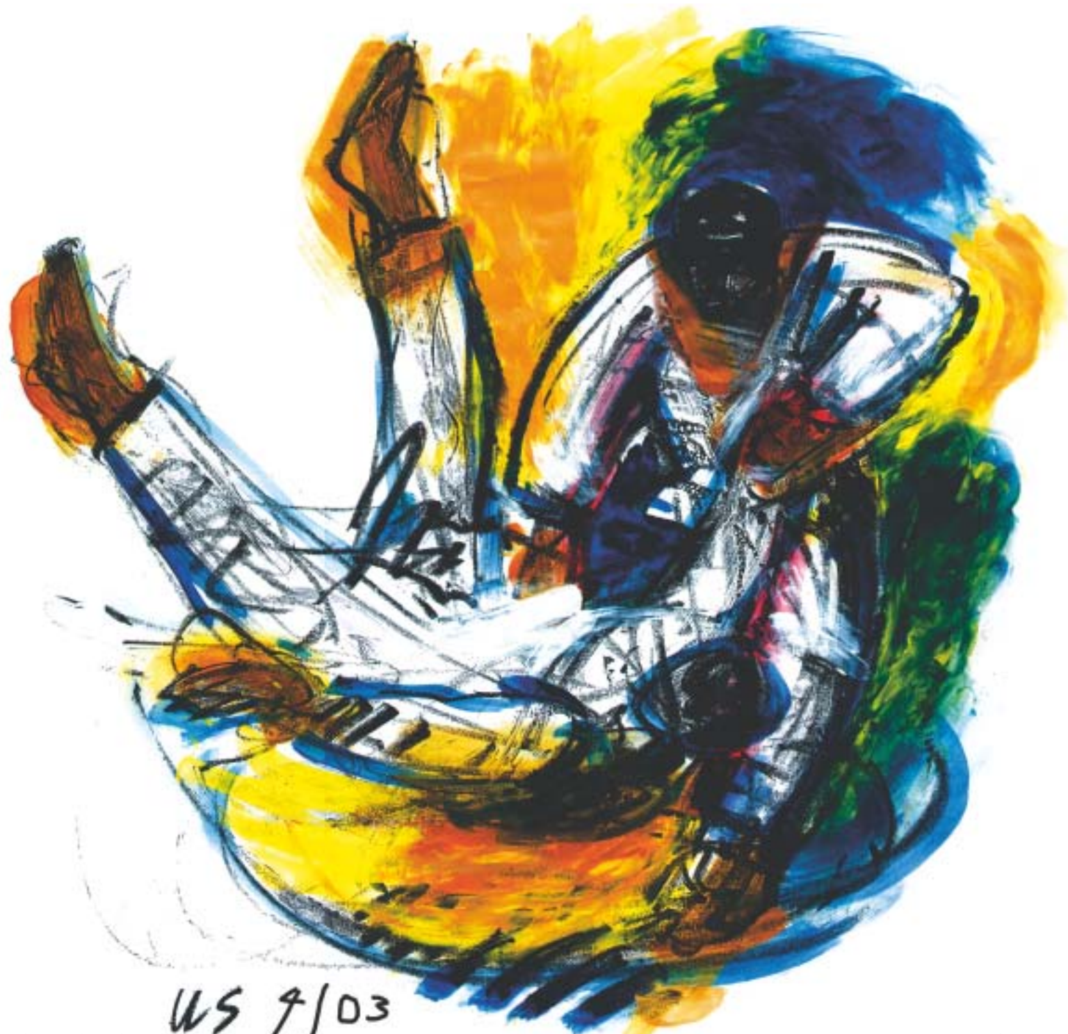
Uli Schaarschmidt, München • Acryl auf Papier • Variation • Wurf #2 • Kata guruma • 60 x 80 cm • 23.6 x 31.5 inches