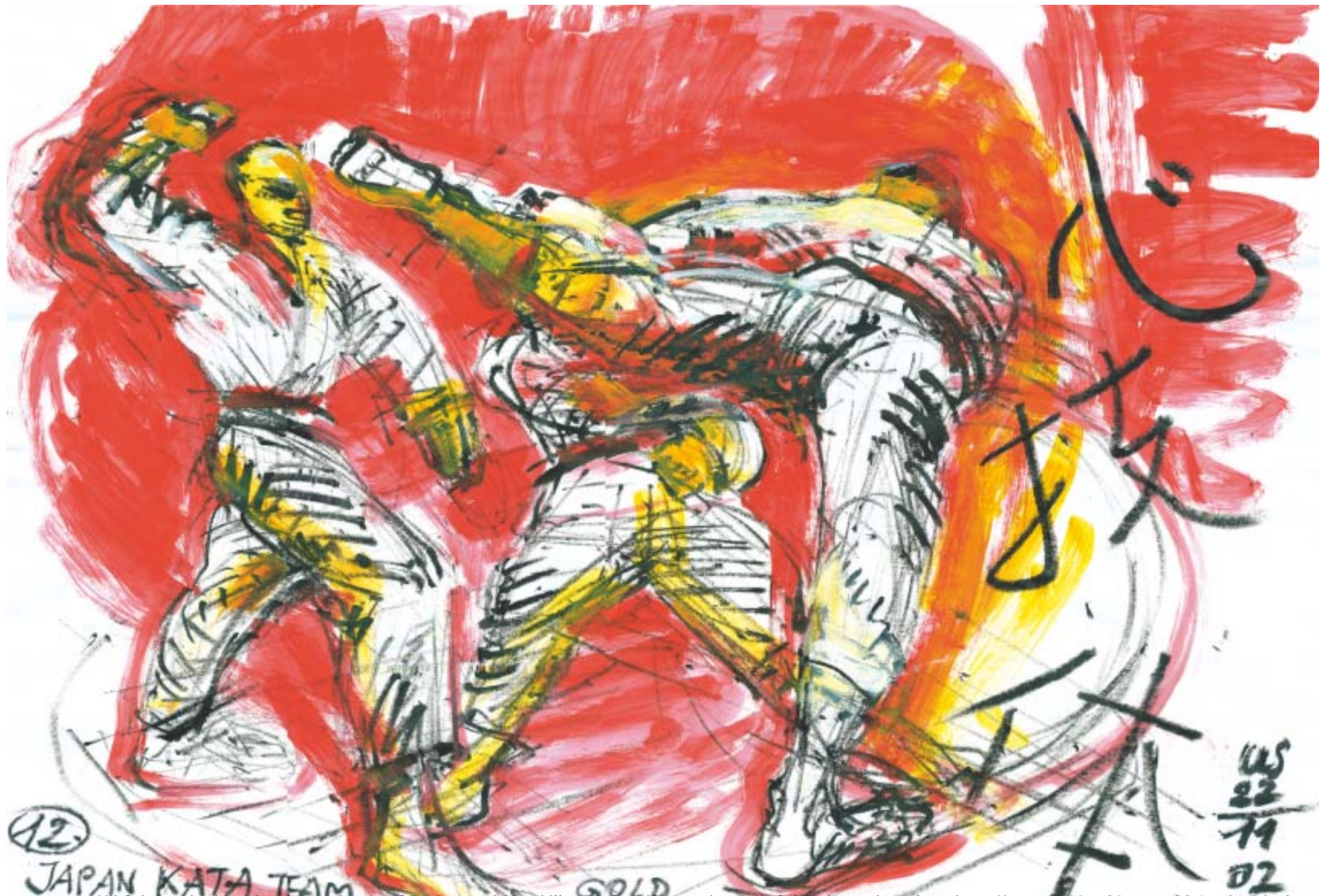
Uli Schaarschmidt, München • Acryl auf Papier • spirit - skills - body • if you miss one of this three, than there is no Karate • 60 x 80 cm • 23.6 x 31.5 inches