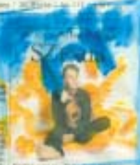
Die Saharaburgers sind in der Sahara gefangen.

Die Bundeswehr hat die Touristen gewaltsam befreit.