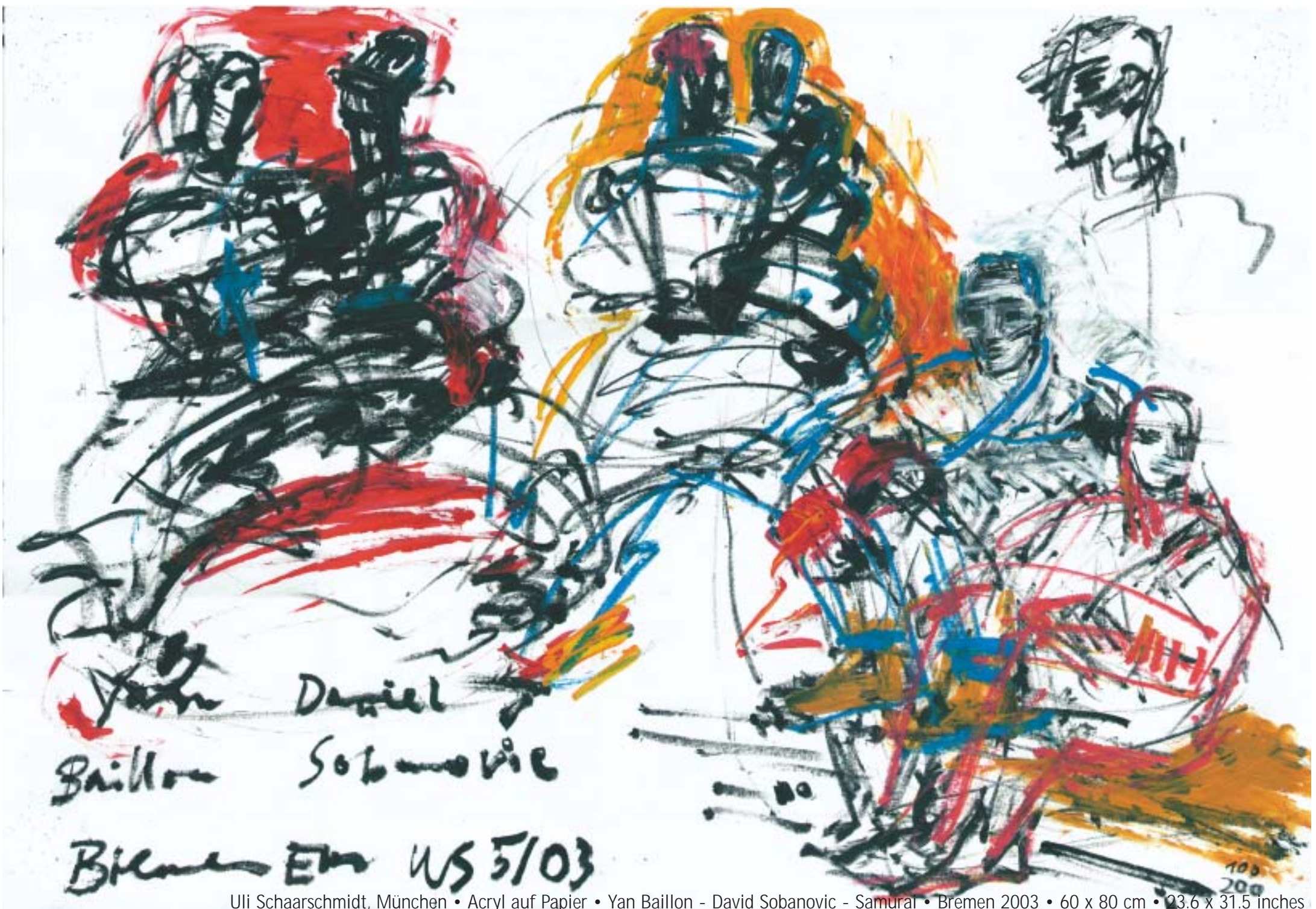
Uli Schaarschmidt, München • Acryl auf Papier • Yan Baillon - David Sobanovic - Samural • Bremen 2003 • 60 x 80 cm • 23.6 x 31.5 inches