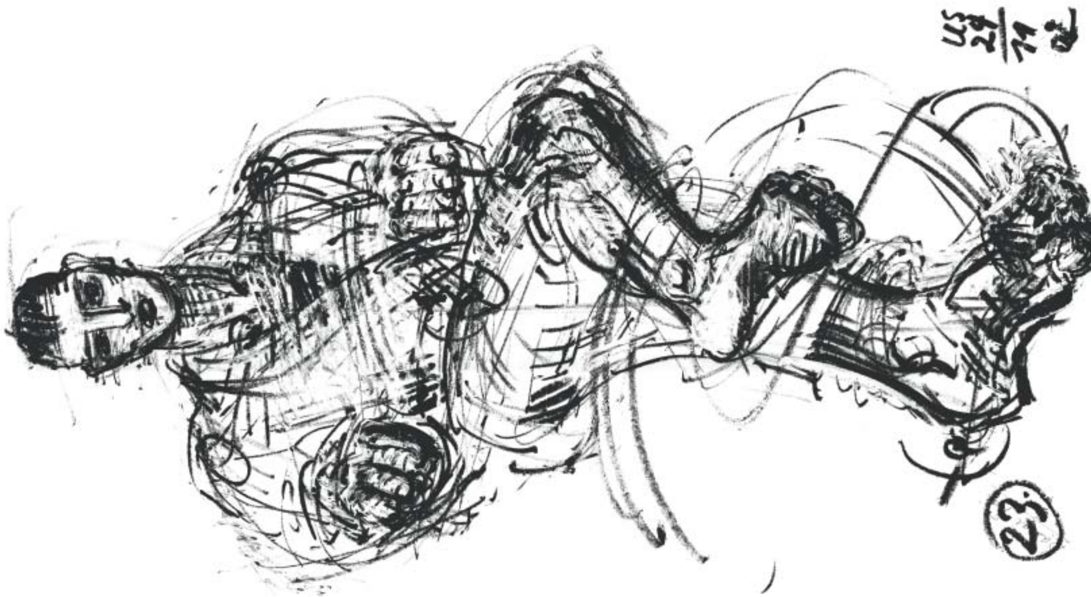
Uli Schaarschmidt, München • Acryl auf Papier • Ushiro mawashi-geri • 60 x 80 cm • 23.6 x 31.5 inches